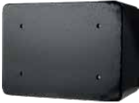
KK300 montaj delikleri