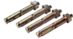
KK300 montaj vidası